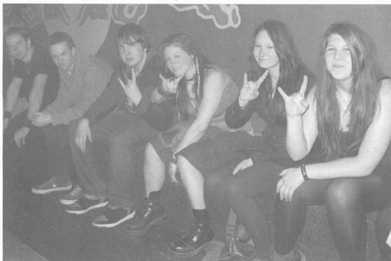
Rockové koncerty si v Chilli užívají všechny generace.

Aš (mv) Quo Vadis? - jste se mohli stylově zeptat návštěvníků, kteří zamířili v dubnovém podvečeru za rockovou hudbou. Vedení Music baru Chilli pokračuje v zajímavých aktivitách, které obohacují kulturní život v Aši. Oblíbenost Chilli podtrhla návštěva koncertu skupiny Quo Vadis. Slušně zaplněný klub si užil rockové hity v podání sympatáků z Chebska ve středu 17. dubna 2013. Prostorem zněly „fláky“ jižanského rocku od ZZ Top, Lynyrd Skynyrd, pop rock The Police, hard rock Black Sabbath a další a další. Mezi návštěvníky byli jak mladí, kteří, usuzující podle vzezření, vyznávají mnohem tvrdší rockové styly, ale také příznivci starého dobrého rocku, kterým ve vlasech zařadil stříbrný vítr v šedinách, či prořídých čupřinách.